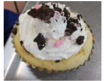
トッピングは班で決めました