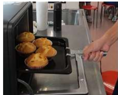
生地をカップに入れて、オーブンへ